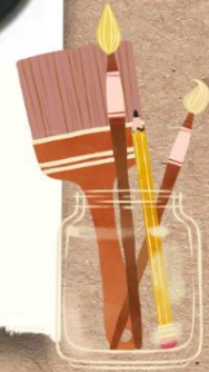
FIGURA - FONDO